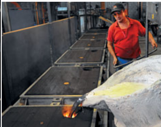
Geschmolzenes Alu fließt aus der sogenannten Pfanne in die Gussform.