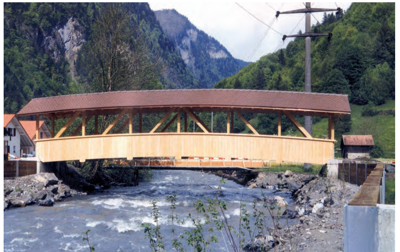
Die Bogenbrücke in Zweilütschinen.